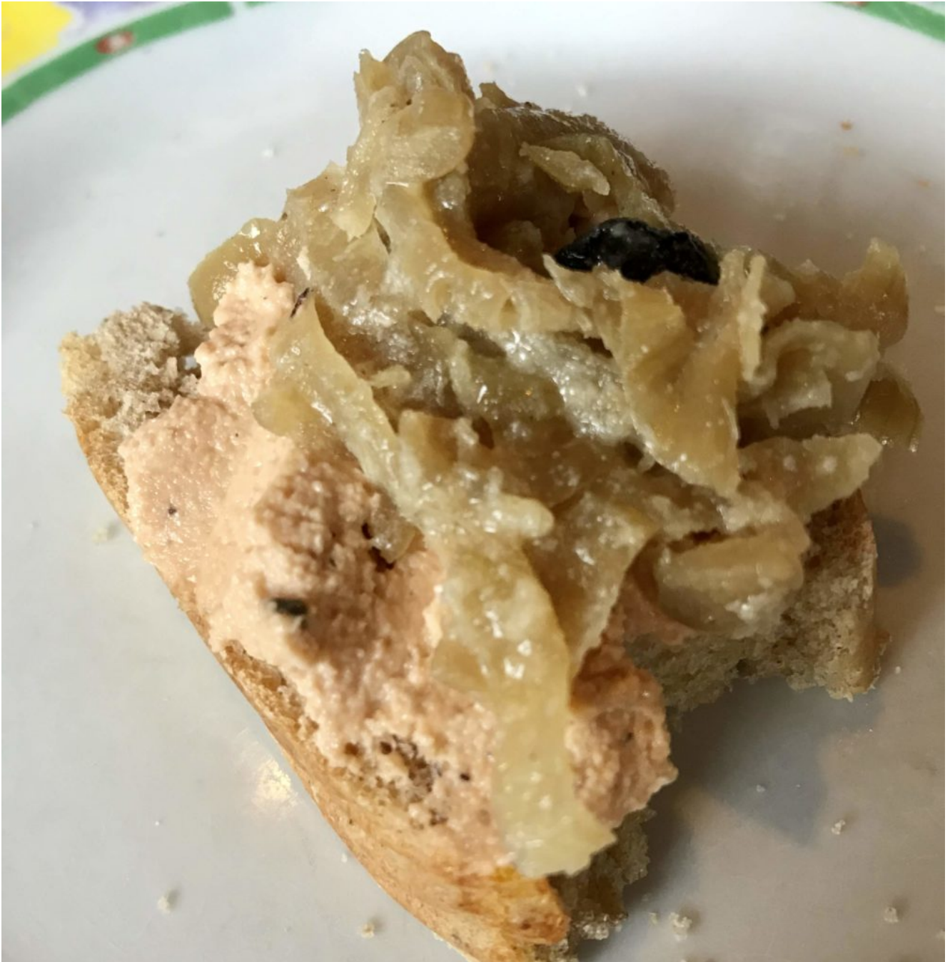
Tartine de faux gras de cajou à la truffe et confit d'oignons