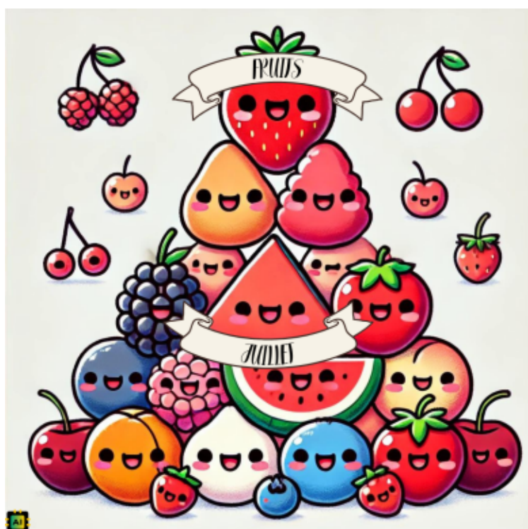
Fruits de Juillet

Dressage : Dans le grand plat de service, la crème est froide. Déposez votre dôme de meringue froide. Faites couler du caramel salé liquide maison. Et il ne reste plus qu'à servir !