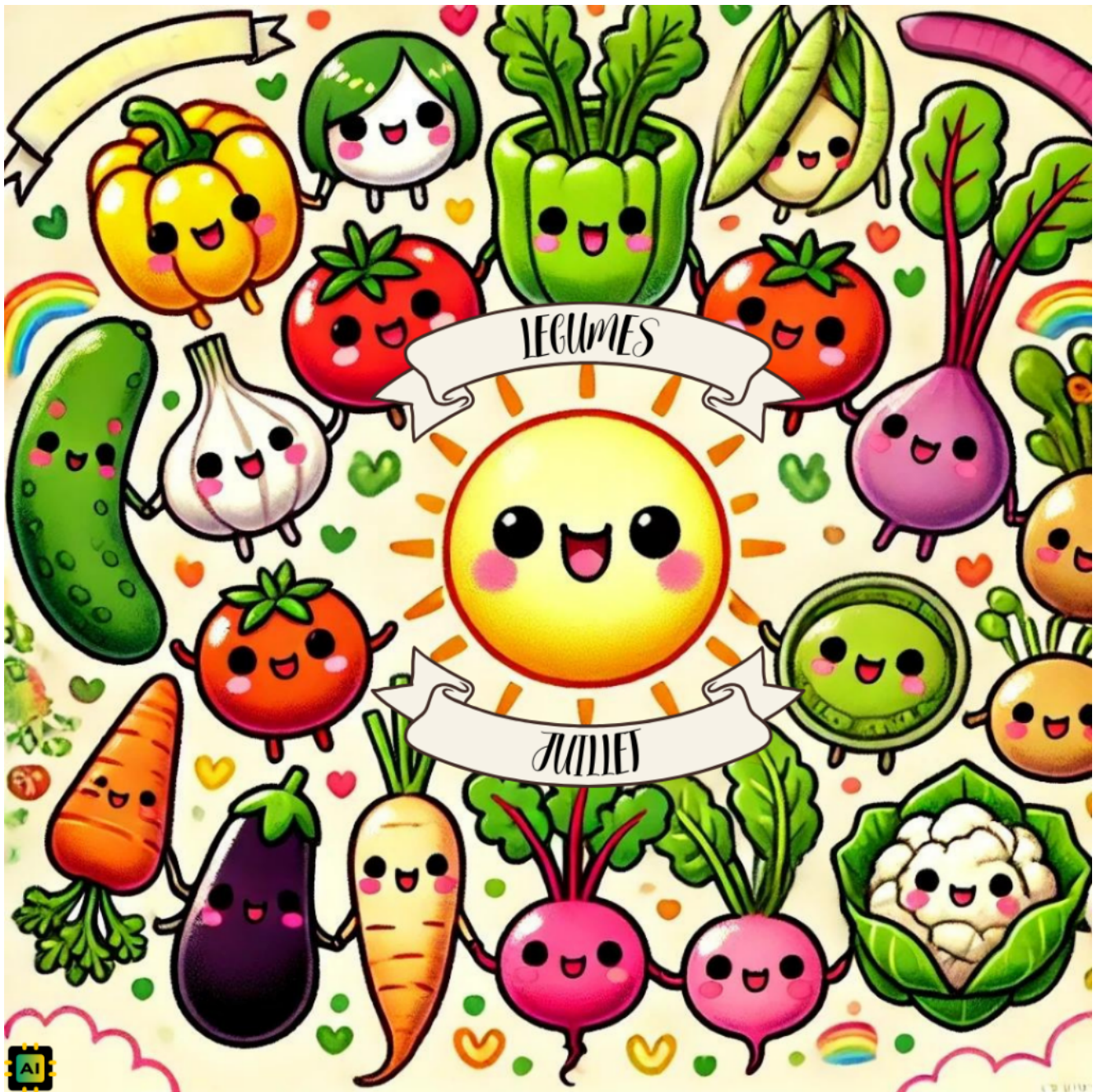
Légumes de Juillet