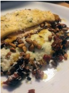
Poulet rôti, viennoise, polenta parmesan basilic, compotée échalotes tomates et pignons torréfiés