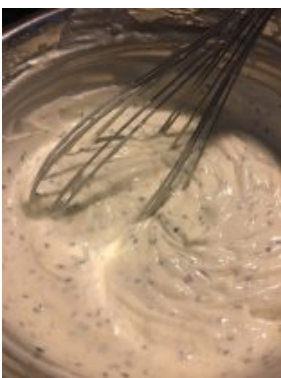
On passe au dessert avec un cheesecake